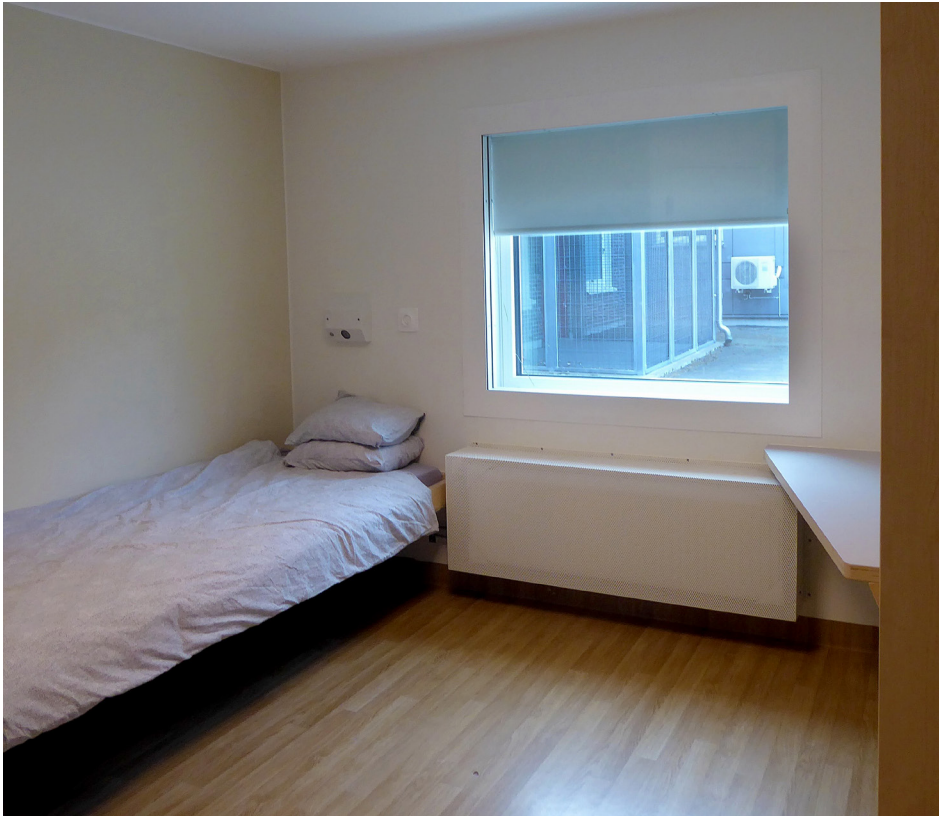
Boenderum i Folåsa

konstaterade att det var oroväckande att en del av de intagna, framförallt de som verkställer sluten ungdomsvård, riskerade att få en sämre skolgång.