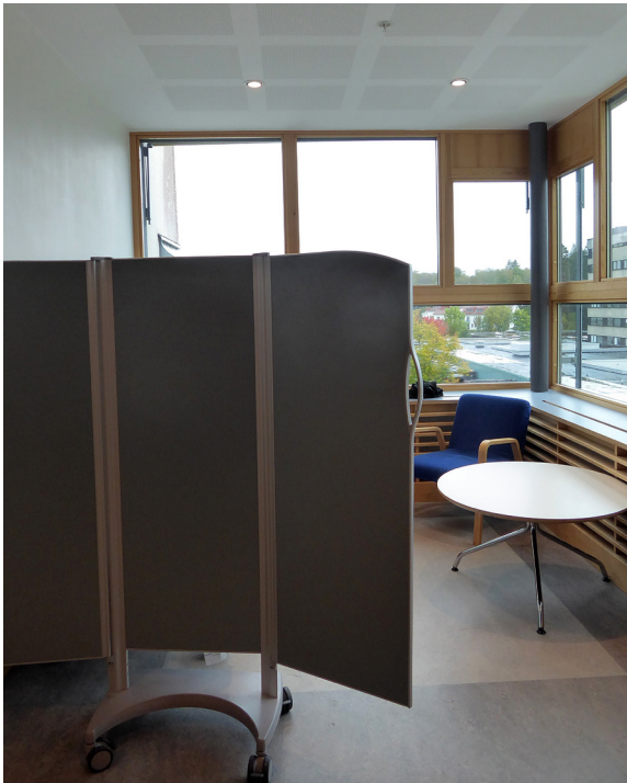
Provisorisk plats på Sahlgrenska