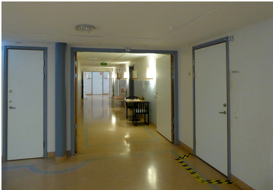
Avdelningskorridor i Säter

Det fanns en märkbar skillnad vad gäller den fysiska miljön mellan den äldre kliniken i Säter och de andra mer nybyggda klinikerna. I Säter var delar av lokalerna trånga, mörka och sparsamt inredda. Det noterades också att cigarett-rök läckte in från rökbalkongerna i sådan omfattning att det orsakade dålig luft och lukt inne på avdelningarna. Övriga kliniker var i gott skick.