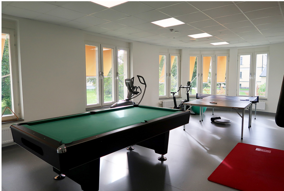
Aktivitetsrum i Växjö