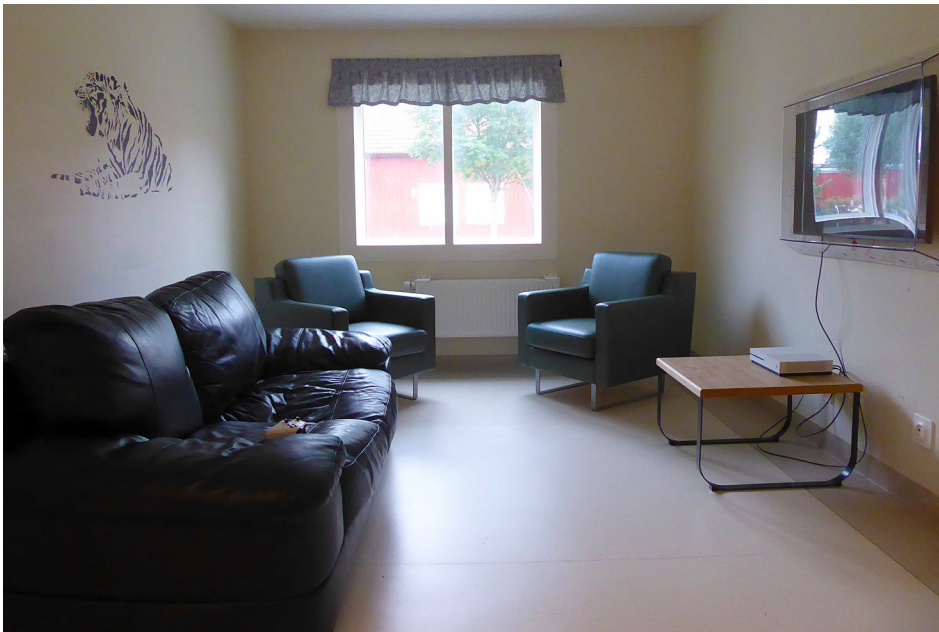
TV-rum i Hornö

Vid ett av hemmen beskrevs att frågor om bemanningen vid hemmet präglades av en hög personalomsättning och att det fanns ett kontinuerligt behov av att