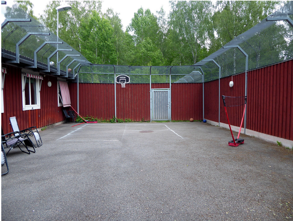
Rastgård i Folåsa

ohygieniska sanitetsutrymmen. JO påtalade att dessa förhållanden riskerade att få konsekvenser för de intagnas fysiska hälsa.