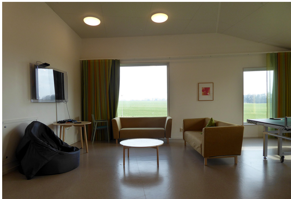
Dagrum i Trelleborg