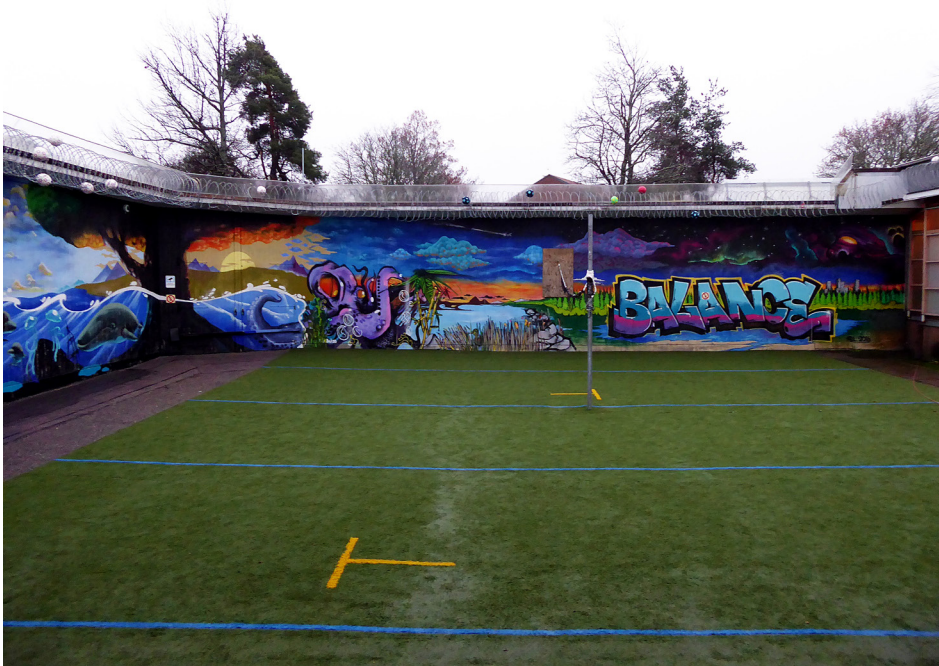
Rastgård i Gävle

gruppträning i en korridor. JO konstaterade att en intagen ska ges tillfälle till aktiviteter, förströelse, fysisk träning och vistelse utomhus. Det är inte tillräckligt med tidsfördriv av olika slag. JO betonade att det är av stor vikt att förvaren erbjuder aktiviteter med ett meningsfullt innehåll. Beträffande utomhusvistelse kunde JO konstatera att förvaren inte till fullo levde upp till rekommendationen från Europarådets kommitté mot tortyr (CPT), om att de intagna bör ha fri tillgång till en utomhusmiljö under hela dagen och som minst två timmar per dag.