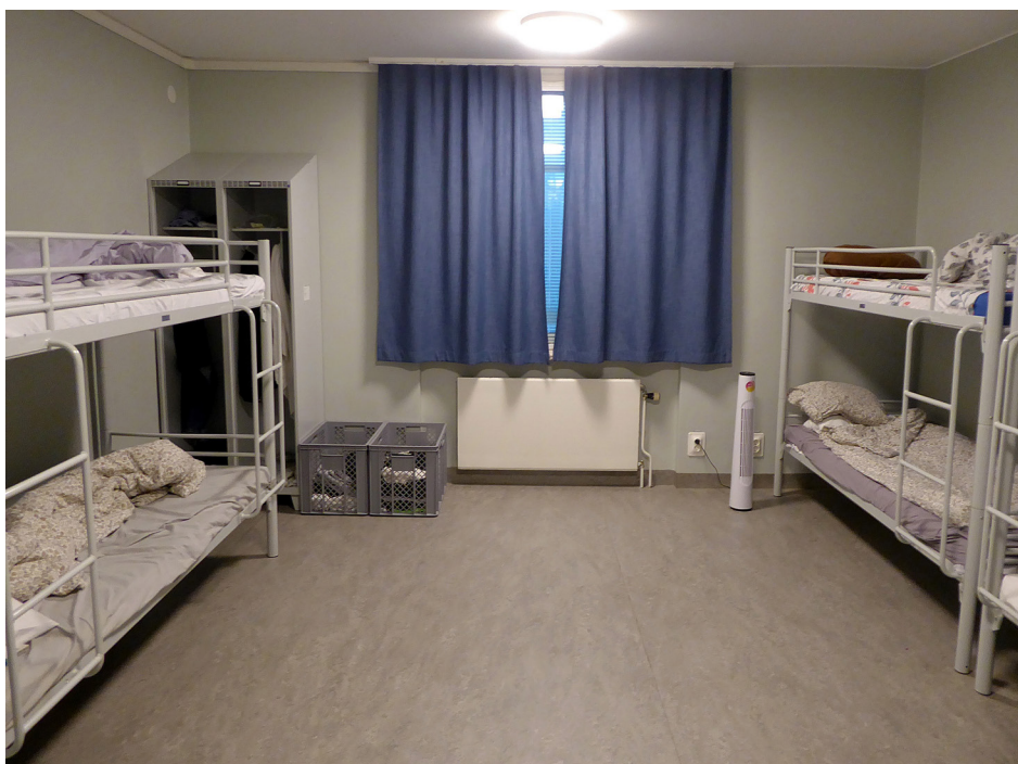
Bostadsrum i Flen

När det gäller frågan om särskilda risker för personer med funktionsnedsättning konstaterade JO att det var problematiskt att de inspekterade förvaren saknade tillgänglighetsanpassade rum eller badrum för intagna med fysiska funktionsnedsättningar. Det kom också fram att varken lokaler eller personal var rustade för att ta emot intagna med särskilda omvårdnadsbehov. JO