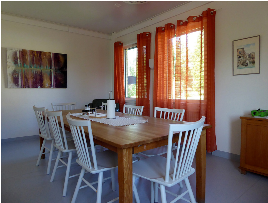
Dagrum i Hornö