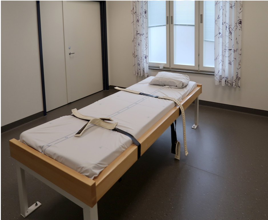
Bältessäng i Växjö

Flera intagna gav uttryck för en bristande kännedom om innehållet i sina vårdplaner eller vilken information de fått om rättigheter och rutiner. JO fann detta bekymmersamt och framhöll vikten av att se till att de intagna faktiskt förstår det som förmedlas.