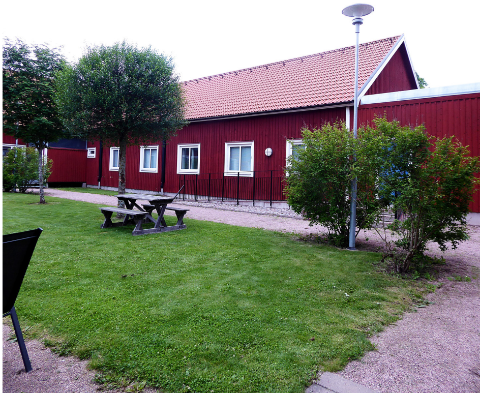
Rastgård i Hornö

Vad gäller innehållet i vården kom det fram vid inspektionerna att de olika hemmen erbjöd behandlingsinsatser i form av programverksamhet på olika sätt och i varierande grad. De insatser som fanns kunde inte alltid genomföras på grund av personalbrist eller bristande intresse hos de intagna. Flera intagna visste dock inte om att det var möjligt att få några insatser och uppgav att de skulle vara intresserade av att delta. Någon intagen hade särskilt efterfrågat behandlingsinsatser men inte blivit erbjuden detta. JO konstaterade att de insatser som erbjuds måste vara lämpliga och anpassade till vad de intagna behöver under tiden som vården pågår. Det var vidare oroväckande att det