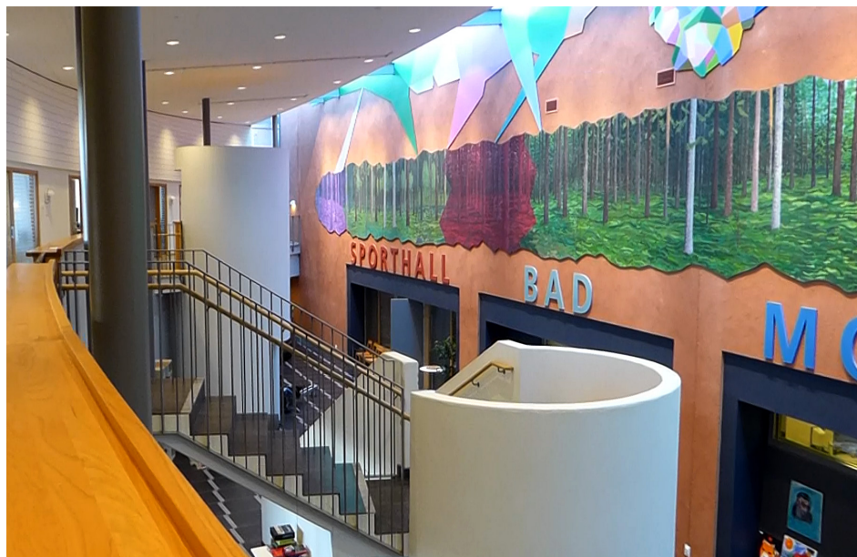
Aktivitetsanläggningen på Rågården

den innehöll sällan konkreta och individuellt anpassade mål och åtgärder. På tre av de fyra klinikerna saknades kontinuerliga uppföljningar av vårdplanerna.